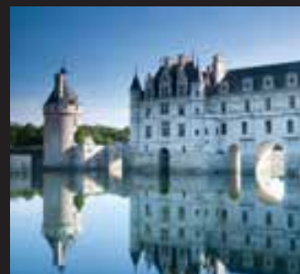
CASTILLOS DEL LOIRA