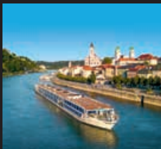
CRUCERO POR EL DANUBIO