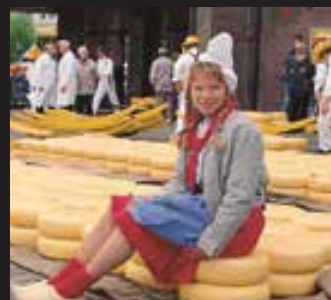
FLANDES Y EL BENELUX