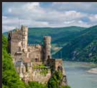
CRUCERO POR EL RHIN