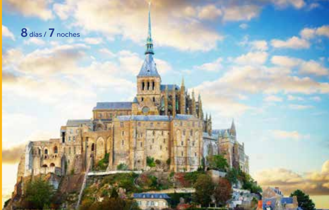
Mt Saint Michel. BRETAÑA.