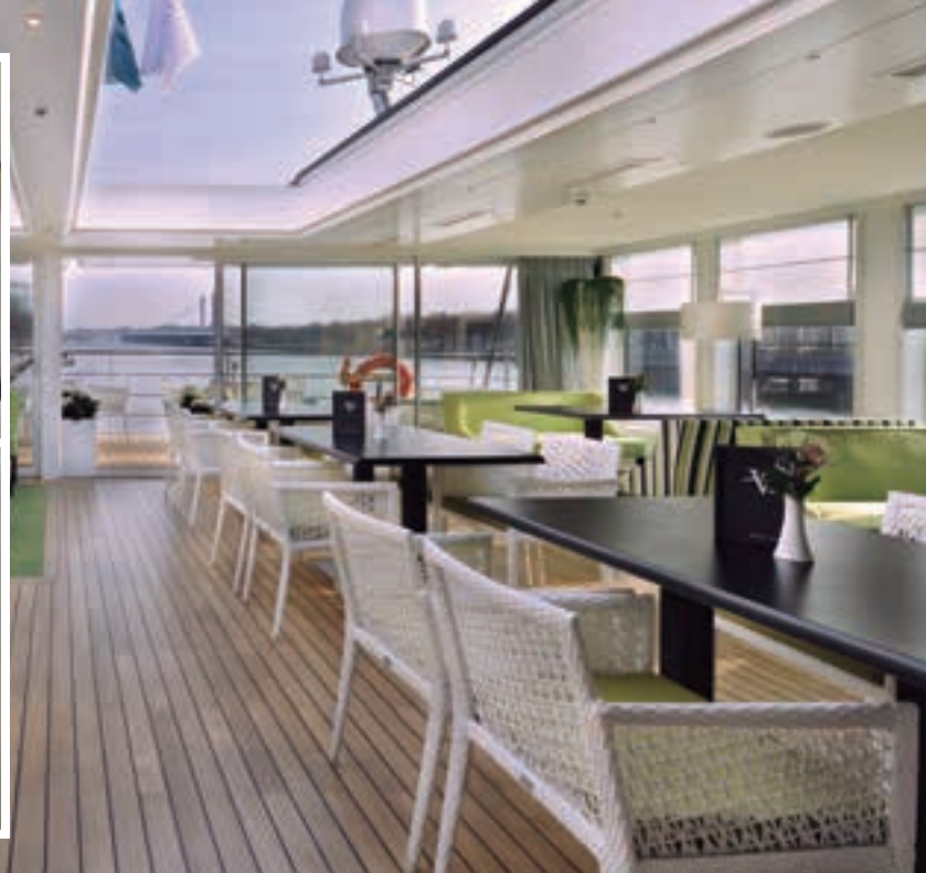
Terraza River Voyager.