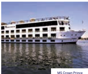
MS Crown Prince