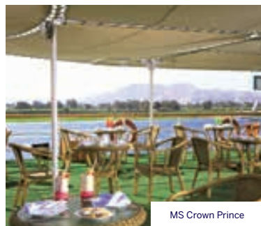
MS Crown Prince