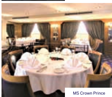
MS Crown Prince