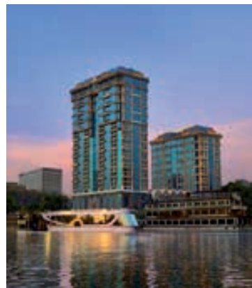
Hotel Four Seasons First Residence

Desayuno y traslado al aeropuerto para embarcar en vuelo especial con destino Madrid. Llegada, fin del viaje y de nuestros servicios