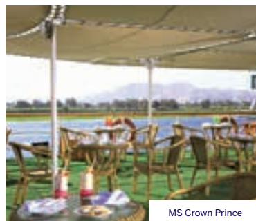
MS Crown Prince