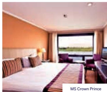
MS Crown Prince