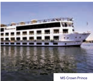
MS Crown Prince