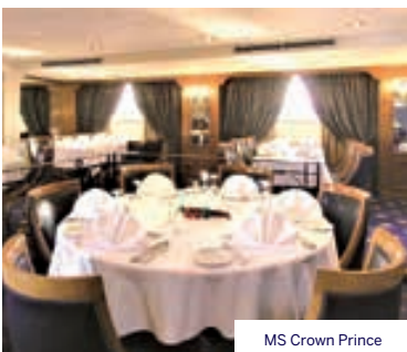
MS Crown Prince