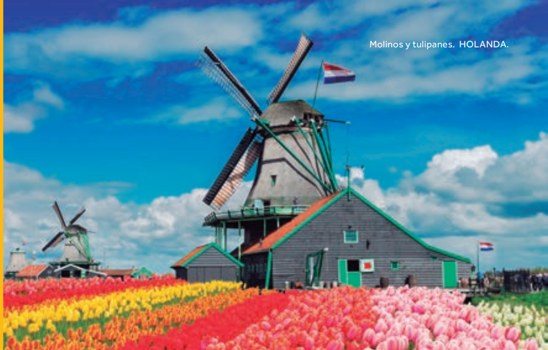
Molinos y tulipanes. HOLANDA.