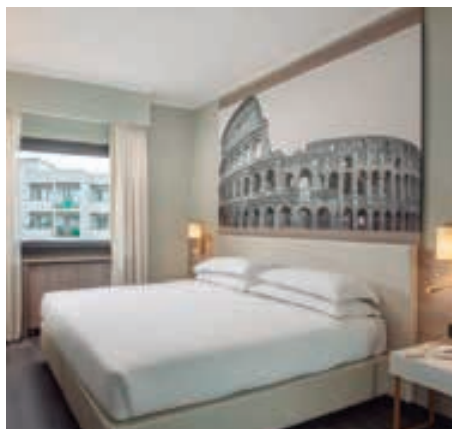
Hotel Marco Aurelio www.hotelmarcaurelio.com/es