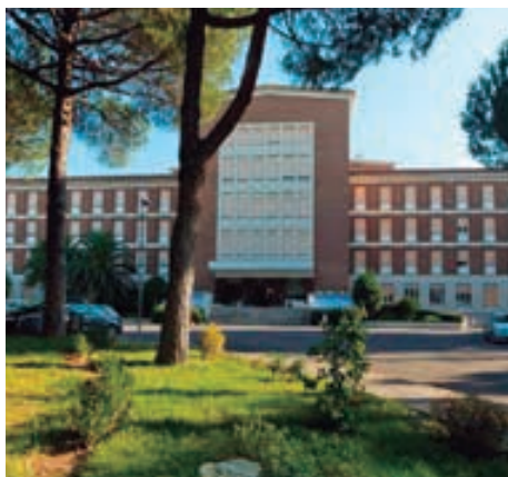
Hotel Green Park Hotel Pamphili www.elegreenparkhotelpamphili.com