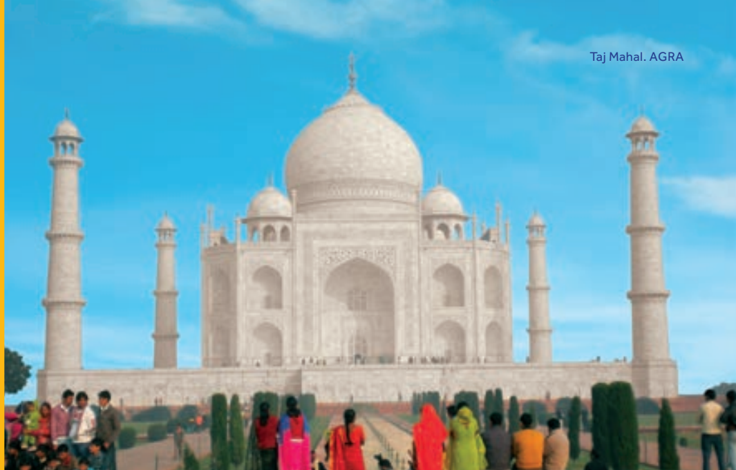
Taj Mahal. AGRA