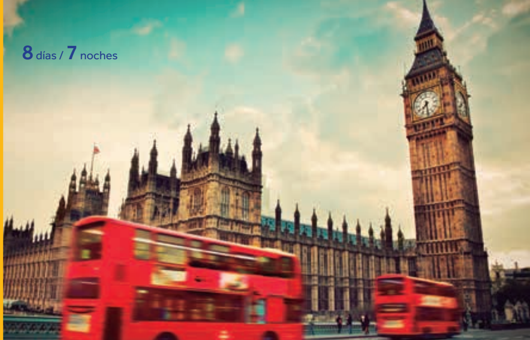
Parlamento y Big Ben. LONDRES.