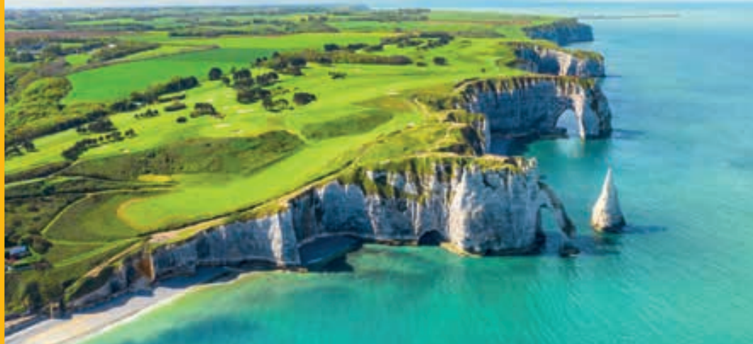
Acantilados de Etretat, NORMANDÍA.